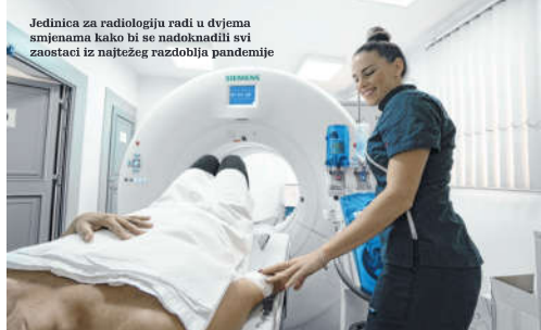
Jedinica za radiologiju radi u dvjema smjenama kako bi se nadoknadili svi zaostaci iz najtežeg razdoblja pandemije