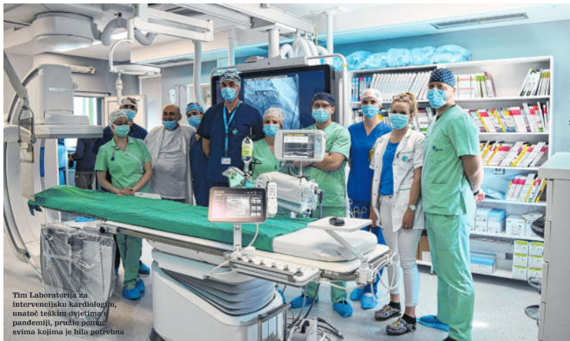
Tim Laboratorija za intervencijsku kardiologiju, unatoč teškim uvjetima u pandemiji, pružio pomoć svima kojima je bila potrebna

"To je razumljivo i bilo je očekivano s obzirom na činjenicu da se dio ljudi, kada govornimo o kardiologiji, nije pojavio u bolnici tijekom pandemije. Procjena je da oko 30 posto onih koji su trebali, nije došlo na intervenciju zbog okolnosti koje je nametnula pandemija COVID-19 bolesti. To ne znači da smo smanjili broj infarkta, nego se ljudi nisu pojavili. Posljedica toga vjerojatno će biti veće komplikacije i to je ono što smo spremni. Kada je riječ o liječenju, ali i o rehabilitacijskim postupcima, kaže ravnatelj opatijske zdravstvene ustanove, ističući i to da prošle godine bolnice u Hrvatskoj nisu ostvarile ugovorne obveze s HZZO-om i isporučiti sve usluge u obimu u kojem se to inače činilo i kako je bilo predviđeno ugovorima. "Zdravstvena administracija mora osigurati da se u razdoblju ispred nas, kako će se odredene usluge kompenzirati, odnosno ostvariti i kako ekonomski gledati na to razdoblje za koje smo dobivali novac, a nismo isporučivali uslugu. To je jedan od