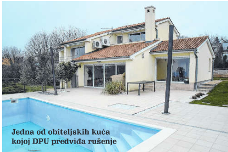
Jedna od obiteljskih kuća kojoj DPU predviđa rušenje

je tu gdje jest i bilo bi puno jednostavnije i sigurno jeftinije proširiti postojeću ulicu nego graditi novu, praktički paralelnu s postojećom, preko kuća i privatnih zemljišta, kažu stanari.