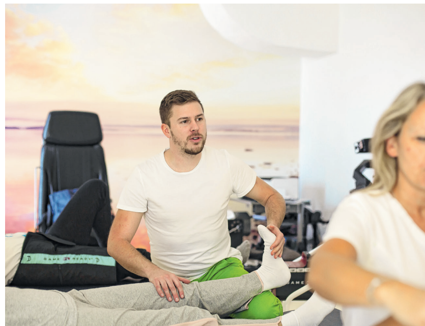
Primjena manualnih tehnika u rehabilitaciji