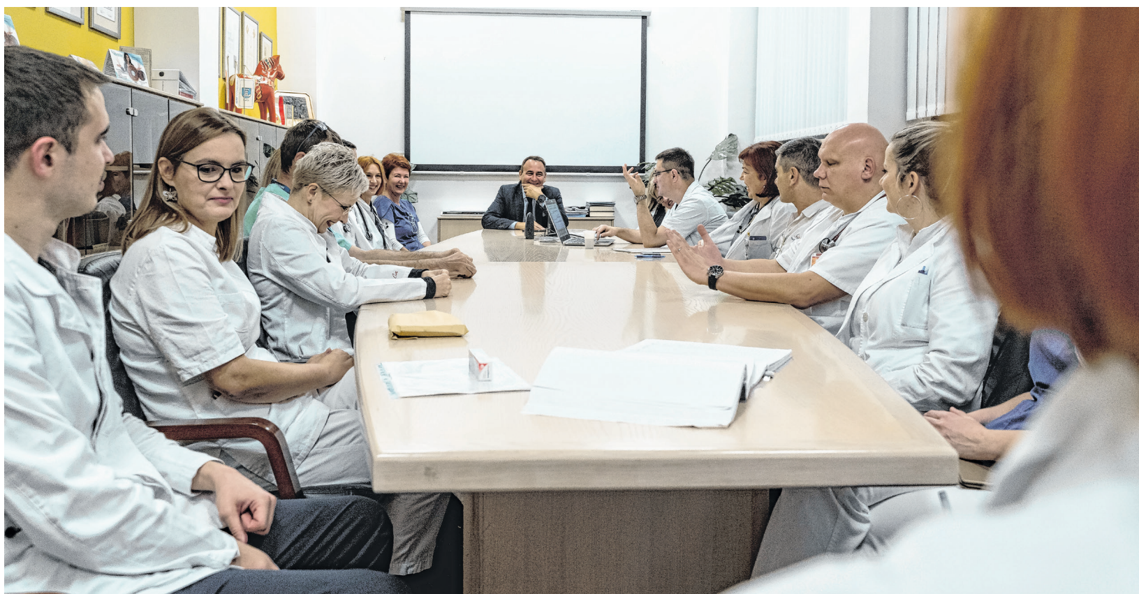
Djelatnici Thalassotherapije na dogovoru s ravnateljem