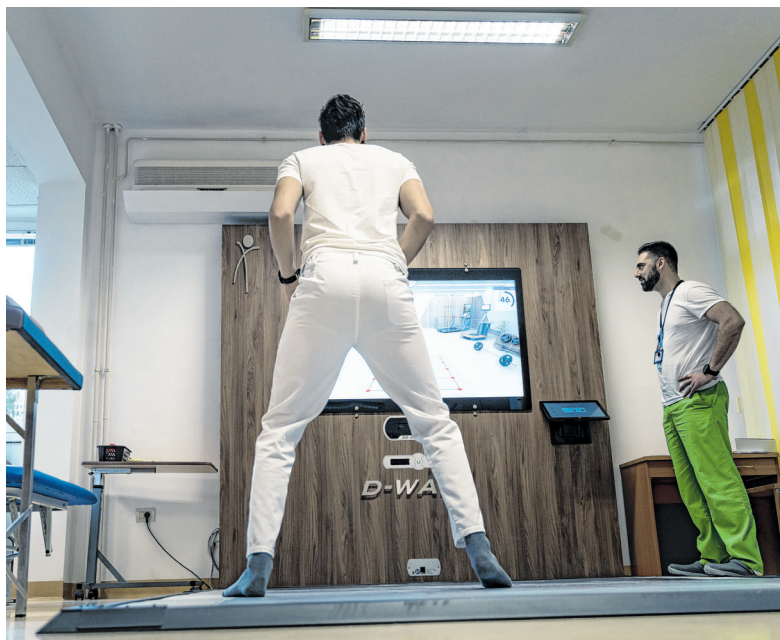
U rehabilitaciji se koriste suvremene tehnologije

Na Danima turizma Thalassotherapia Opatija redovito